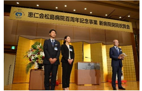
松島理事長よりご挨拶