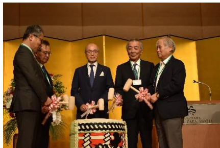
よいしょ！よいしょ！よいしょー！！